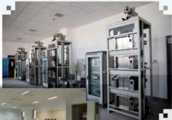
智能电梯安装调试 维护训练场所