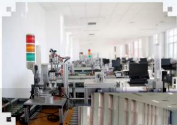
自动化生产线安装与 调试训练场所